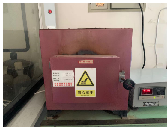
图 2 格致楼 4010，没有使用记录本