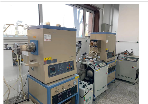
图4 理工楼 101，没有使用记录。