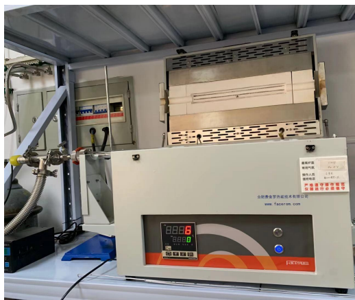
图 1. 格致楼 1031，没有使用记录。