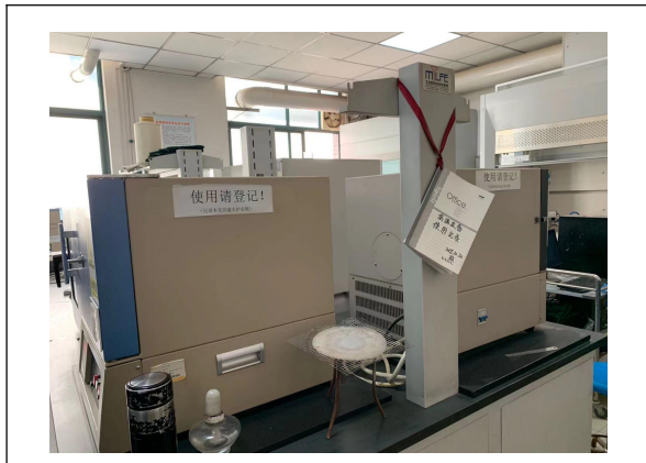
图3 格致楼 3037，没有登记使用记录。